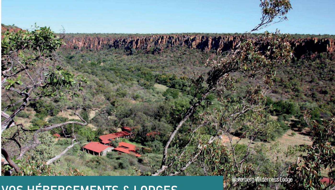
Waterberg Wilderness Lodge