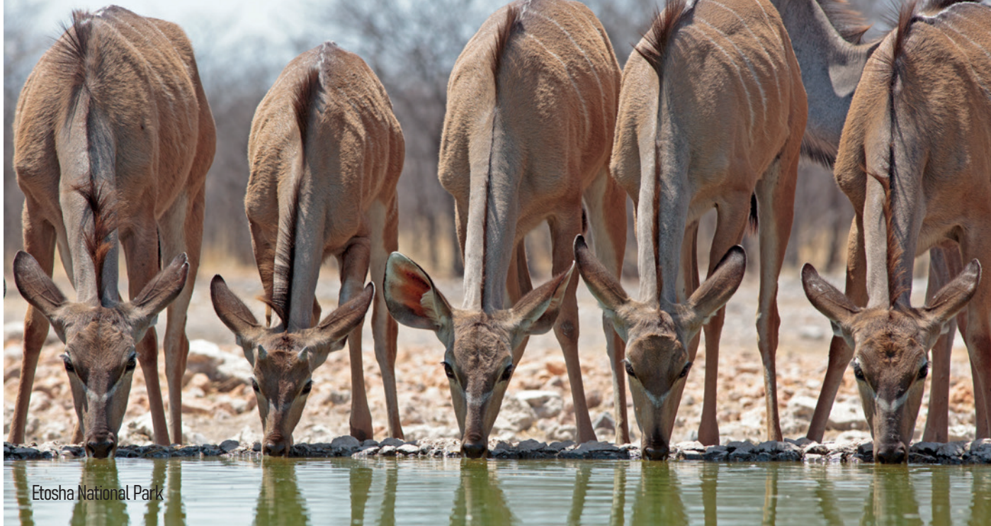
Etosha National Park