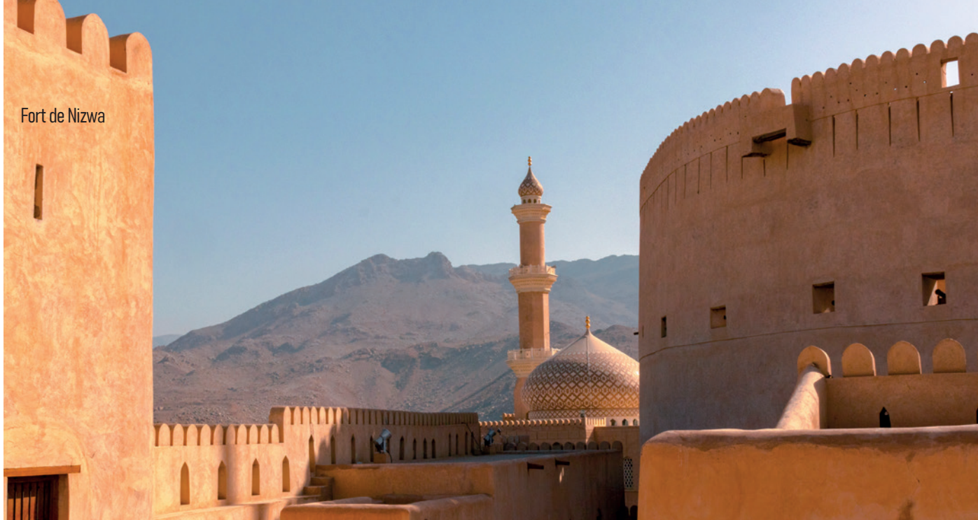
Fort de Nizwa

Nizwa et faisons notre check-in à l'hôtel Falaj Daris 4* à Nizwa. Diner et nuitée à l'hôtel.