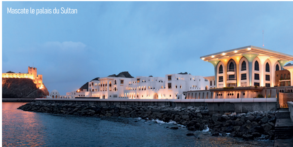
Mascate le palais du Sultan

Arrivée à Bruxelles en matinée, des souvenirs plein la tête.