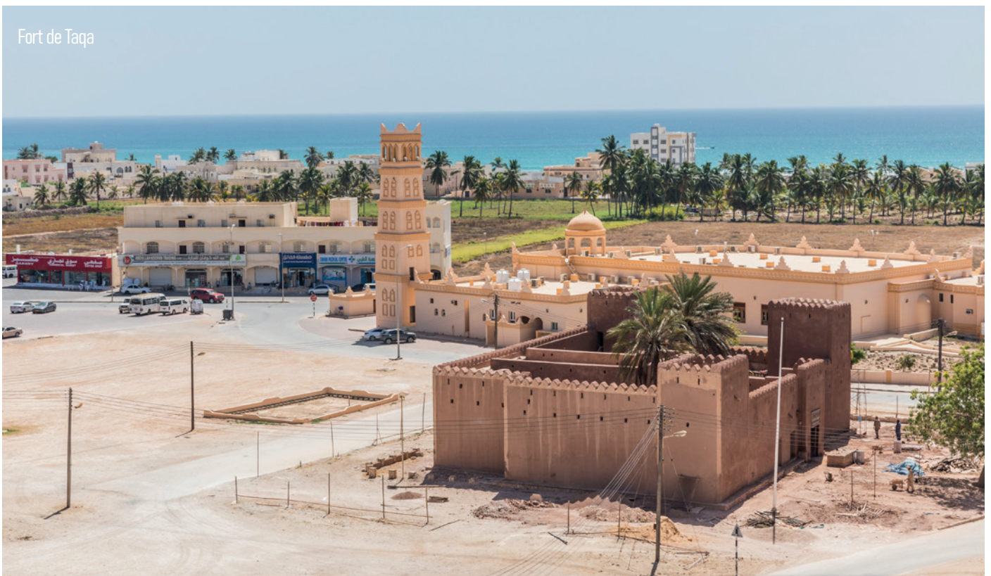
Fort de Taqa

Petit déjeuner à l'hôtel. A 9H30, visite d'une ferme-jardin, avec des cocotiers, des bananiers, des papayers et des légumes. Ensuite, nous visiterons le souk Al Husn où sont vendus des cristaux d'encens du Dhofar et des brûleurs d'encens typiques de la région. Nous continuons par la visite du village de pêcheurs de Taqa, une vieille ville avec un intéressant château entouré de tours de guet et de maisons en pierre de Taqa. Visite du fort de Taqa.