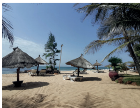
New Royal Baobab Horizon https://www.newhorizonshotels.com/