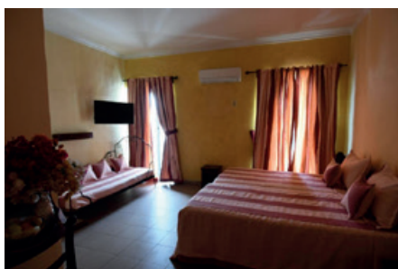
Saint Louis - Hôtel de la Poste https://www.hoteldelapostesaintlouis.com/