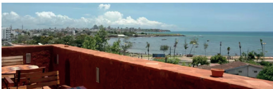
Dakar : Le Djoloff https://www.hoteldjoloff.fr/