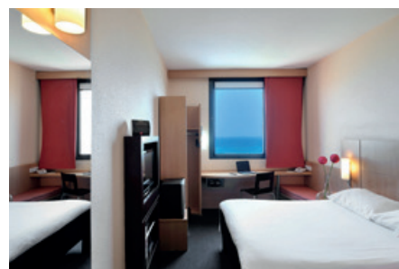
Dakar : Ibis https://all.accor.com/ssr/app/ibis/rates/6777/index.fr.shtml?compositions=1&dateIn=2024-01-24&nights=1&hideHotelDetails=false&destination=dakar-senegal&utm_