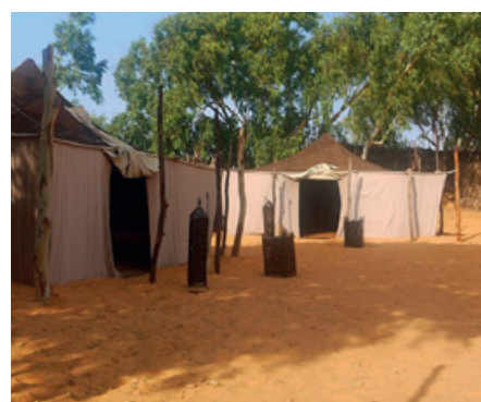
Lompoul : bivouas nomade