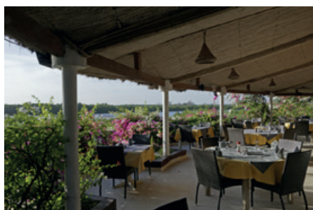
Toubacouta - Lodge Keur Saloum https://pamojaafricatz.com/index.php/accommodations/pamoja-serengeti-luxury-camp