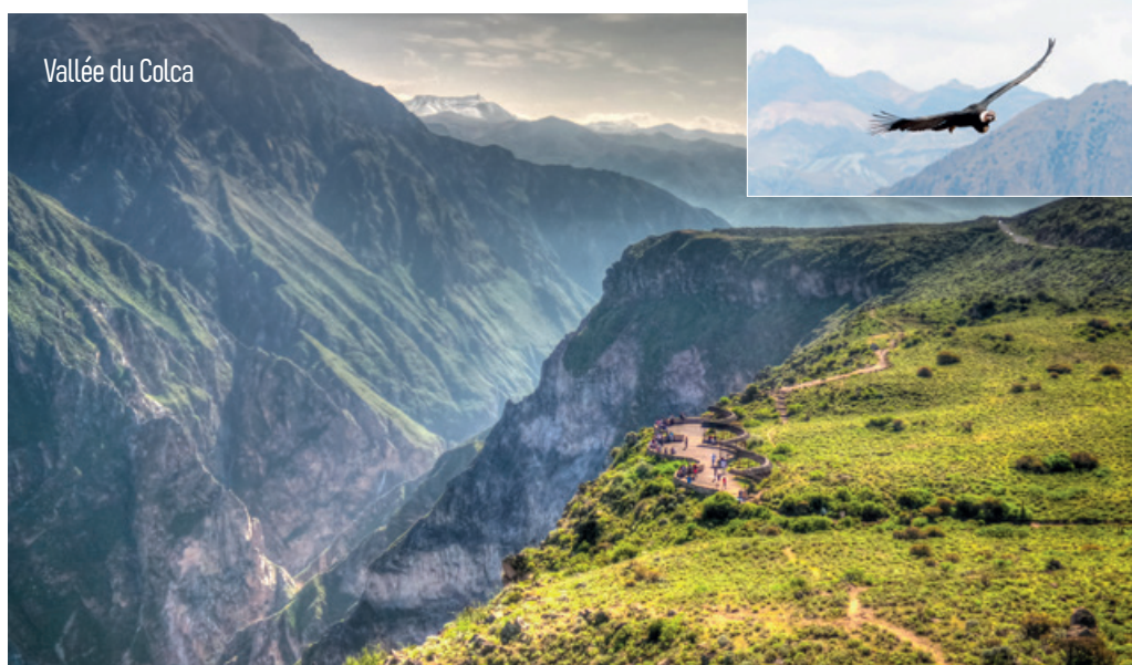
Vallée du Colca

la vallée. Déjeuner dans un restaurant local où nous goûtons à la viande d'Alpaga. L'après-midi, moment bien-être à la station située à 4 km du centre de Chivay : 2 grandes piscines, 1 intérieure et 1 extérieure, permettent de se baigner dans les eaux à 38°, aux propriétés curatives. De nature sulfureuse, elles sont riches en fer, en calcium et en zinc. Cette haute concentration en minerais et en oligoéléments leur confère des vertus médicales avérées contre quantité de maux, à l'exemple du rhumatisme ou l'arthrite. Serviettes de bain à louer sur place. Arrivée en suite à notre hôtel. Installation à l'hôtel situé près du majestueux Canyon du Colca . « Mate de coca » ou thé de Muña de bienvenue. Dîner et nuitée à l'hôtel.